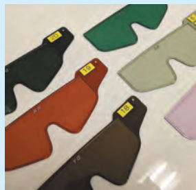
👁️ 「遮光眼鏡」紫外線をカットし眩しさを軽減する医療用眼鏡

小児の先天異常や成人の眼の疾患、事故による眼外傷などによって十分な視力が得られなかったり、視野が狭くなり日常生活を不自由に感じておられる「ロービジョン」の方には、一人一人の見え方にあった補助具の選定や視機能の活用を支援します。また日常生活の工夫や地域の福祉、就労や生活などのリハビリテーションの情報提供を行います。