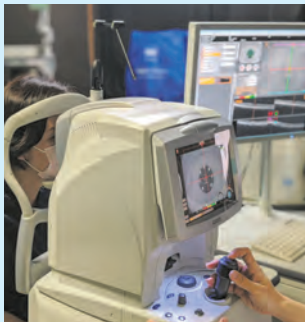
👁️ 眼底画像検査の様子

視能訓練士は、視力・眼圧・屈折・視野・眼底写真など幅広い眼科検査を担当しています。各種検査によって得られる様々な情報で質の高い診療が可能になります。また、眼鏡やコンタクトレンズの検査も行っています。